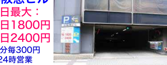
北阪急ビル駐車場

北阪急ビル 当日最大: 平日1800円 休日2400円 30分毎300円 8-24時営業