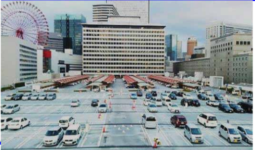
阪急大阪梅田駅駐車場/24H

梅田ど真ん中の駐車場! 約660台・ハイルフ車駐車可!(高さ2.2m迄) 最初1時間600円、以降30分毎300円