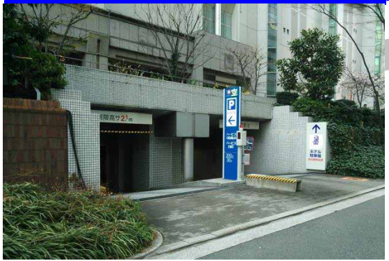
ハービスOSAKA・ENT駐車場

空港バス停留所隣接!約690台駐車可! ハイルフ車可(高さ2.3m(一部2.1m)迄) 料金:30分毎300円 6時半~24時半営業