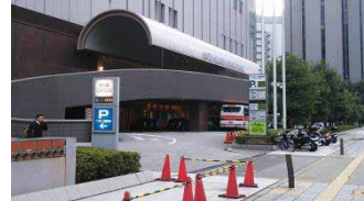
アプローズ駐車場

ホテル阪急 インターチャイル直結 約390台 駐車可 30分毎250円 7~23時営業