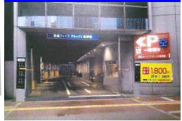
ファイブ アネックス駐車場