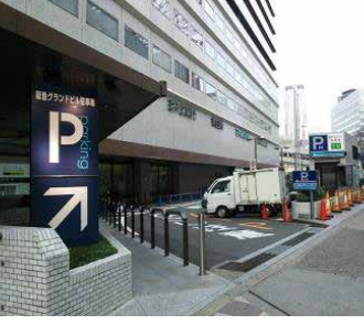
阪急ランドビル駐車場

8-18時:20分毎200円 18-翌2時:30分毎300円 2-8時:1時間毎100円